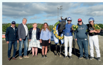
LÅNGA E3-FINALERNA BERGSÅKER 1 JULI STON

E3 och våra samarbetspartners gratulerar årets fyra vinnare. I samtliga finaler plockade vinnarna hem förstapriset på en miljon kronor!