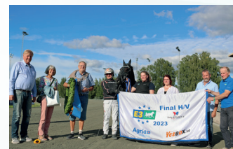
KORTA E3-FINALERNA ROMME 19 AUGUSTI HINGSTAR/VALACKER