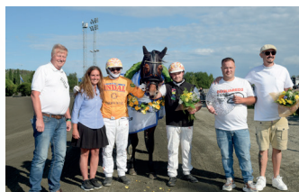
LÅNGA E3-FINALERNA BERGSÅKER 1 JULI HINGSTAR/VALACKER