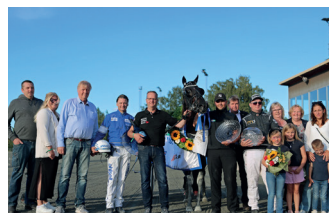
KORTA E3-FINALERNA ROMME 19 AUGUSTI STON